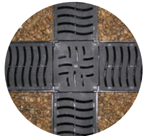
Hjørnet gør systemet yderst fleksibelt