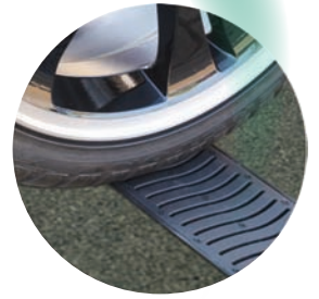
Velegnet til garageindkørsel