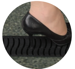
Fremstillet i ét stykke med Anti-Slip-System