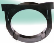
Unik afløbsstuds, som passer til forskellige manchetter